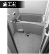
0.75坪のユニットバス

入進学、転勤のシーズンですね。この時期は、「アパート」などの改修工事も多いです。今回は、新しく入居される方のために浴室リフォームを行った須賀川市の「ファミリーマンションアムフルス」さんをご紹介します。