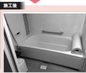
1.0坪のシステムバスにサイズアップ。広い浴槽で足をのぼしてゆったりできますよー!